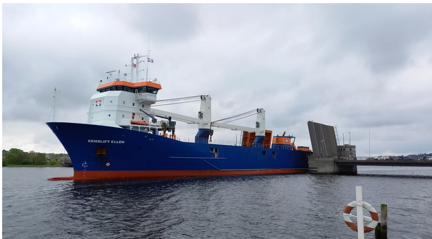
Kæmpeskib på vej gennem Hadsundbroen - gad vide, om der er plads

Det undgik man dog - blot for lidt efter at være tæt på at gå på grund ud for lystbådehavnen.