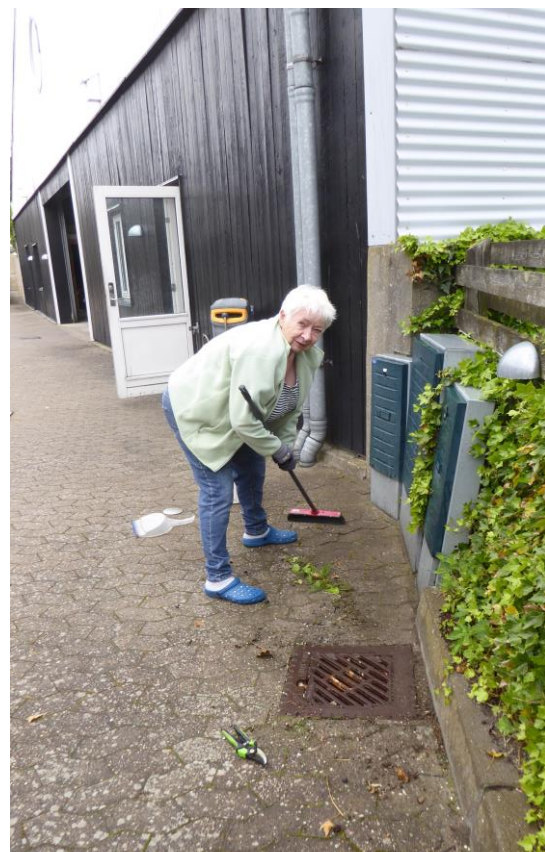
En lugekone i fuld gang

Et par trælse regnbyger var den tidlige formiddags friske hilsen til os.