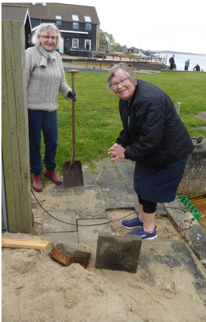
Smilende brolæggerjomfruer på vej til at slutte sliddet