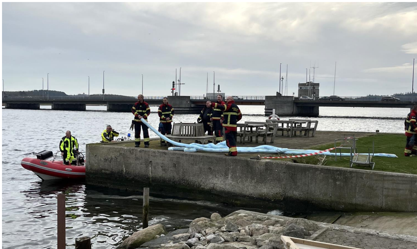
Klargøring af flydespærre.